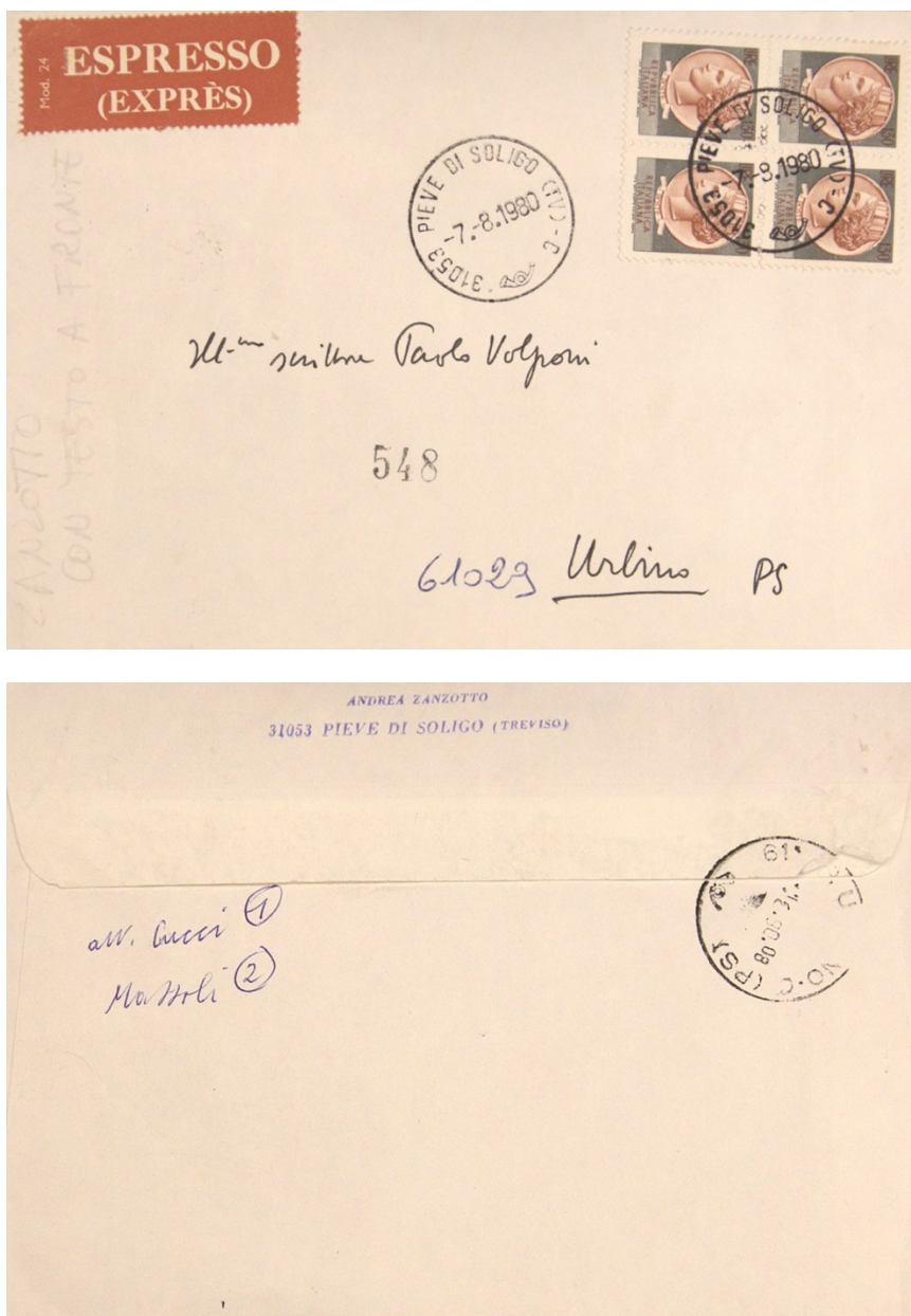
FIG. 2. Busta manoscritta recto e verso della lettera di Andrea Zanzotto a Paolo Volponi.