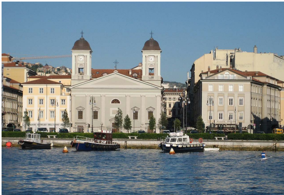
Fig. 03 - La chiesa di San Nicolò dei Greci a Trieste.

Andrea Pergola | andrea.pergola@unica.it