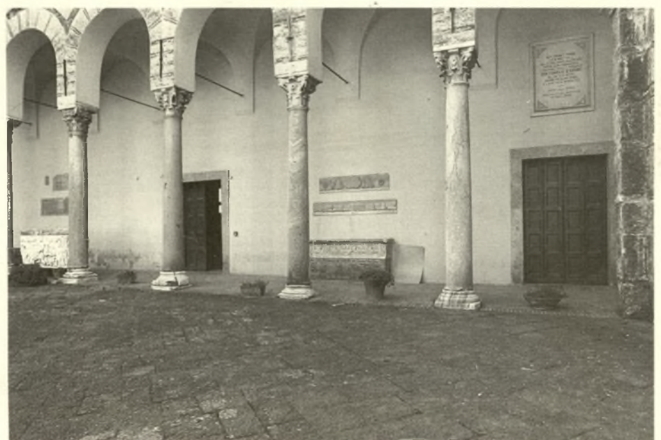
Sala S. Tommaso.

SISTEMA BIBLIOTECARIO DI ATENE - SALERNO