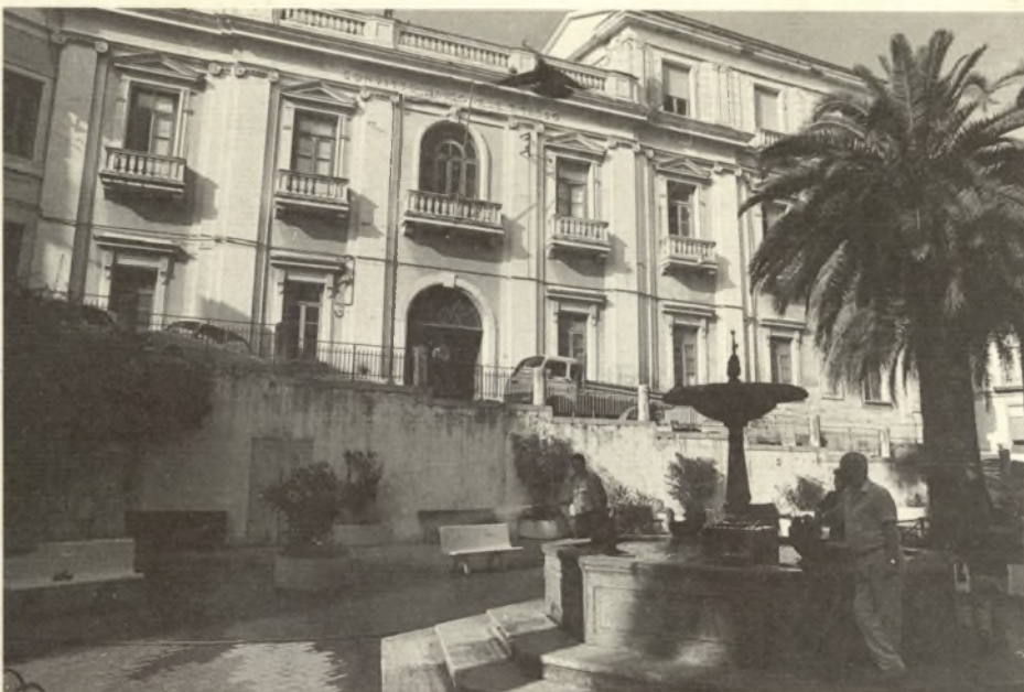
Convitto Nazionale "T. Tasso"

L'aria sia pura, piena di luce, e del tutto limpida; non sia infetta, nè riceva i miasmi di fetida fogna.