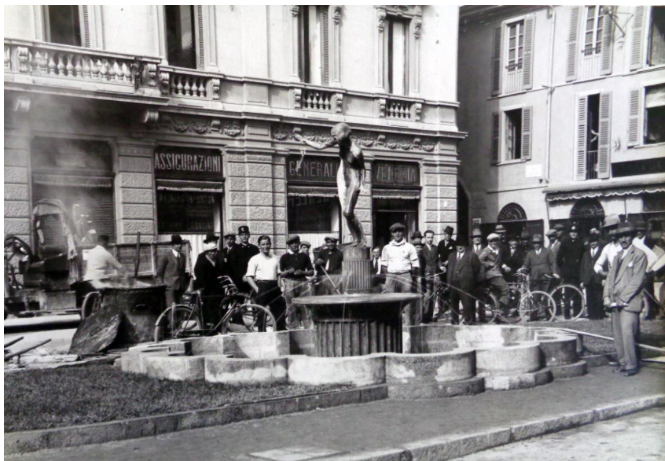
Piazza Roma, prima metà del Novecento

Stefania Manni Redazione newsletter AIPH