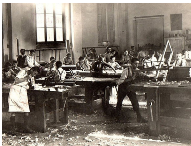
Prima Scuola Professionale a Lissone (MB), 1922

Come menzionato nella premessa al nostro statuto, la nostra associazione contribuisce a diffondere riflessioni sulla natura e l'essenza della Public History italiana che possano influenzare le sue pratiche sociali e professionali, anche attraverso il confronto con quanto si fa in altri paesi. L'accesso alla storia deve diventare diritto fondamentale delle comunità ed è certamente un bene comune delle nostre società. È anche un ambito professionale ricco di prospettive lavorative nei settori della comunicazione, dei media digitali, dello spettacolo, della conservazione, dei beni culturali, del tempo libero e del turismo, solo per citarne alcuni.