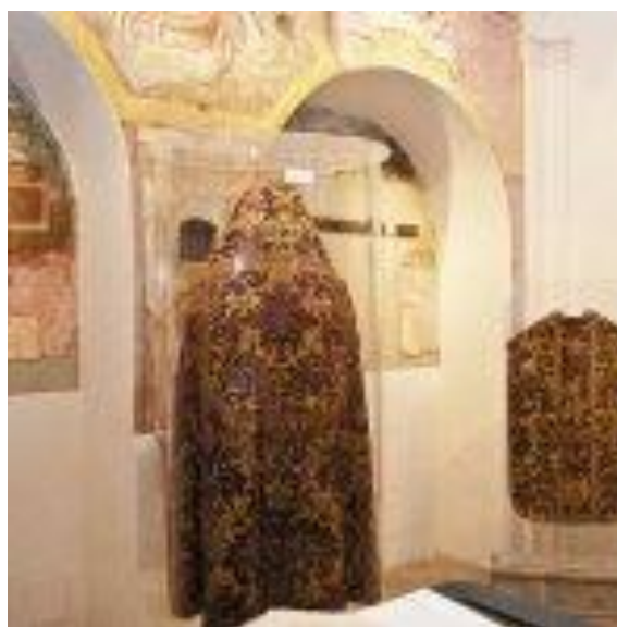
Museo civico dei parati, Montemarano