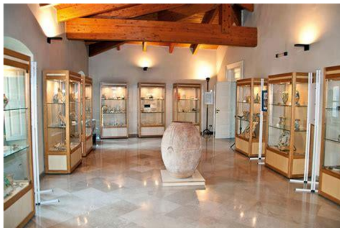
Museo della ceramica, Ariano Irpino