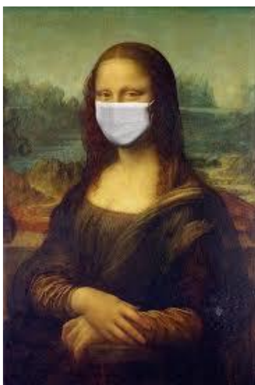
La Gioconda al tempo della pandemia