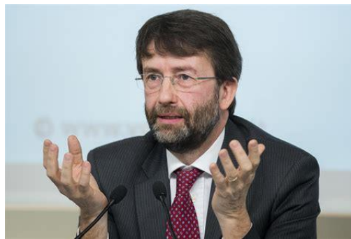
Dario Franceschini, ministro dei Beni e delle Attività Culturali e del Turismo