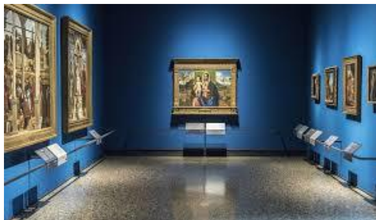
Galleria degli Uffizi, Firenze