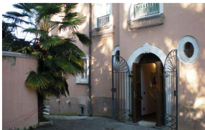
Museo Civico Villa Amendola, Polo museale, Avellino