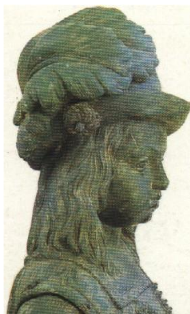
Cosimo Fanzago, part. Il Re di bronzo , Villa Amendola, Avellino