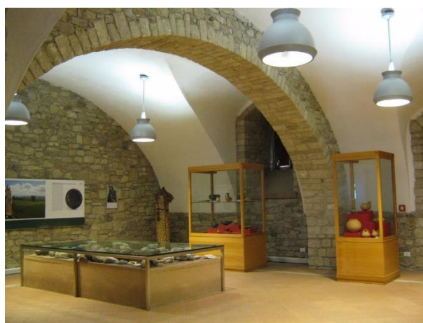
Museo civico archeologico di Bisaccia