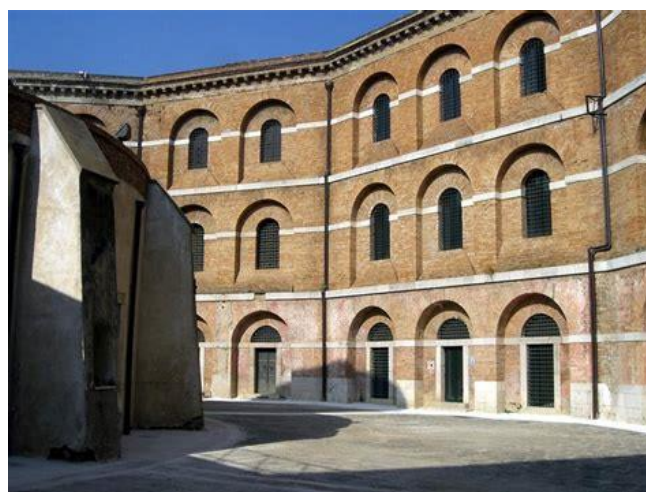
Ex Carcere Borbonico, Polo museale, Avellino