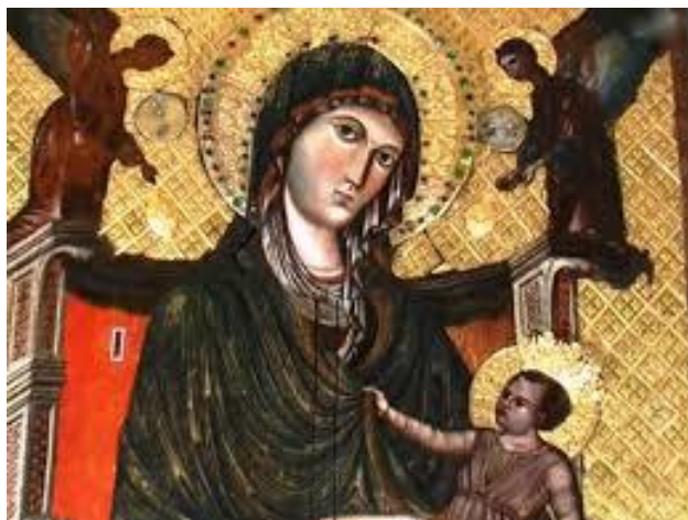
Madonna di Montevergine