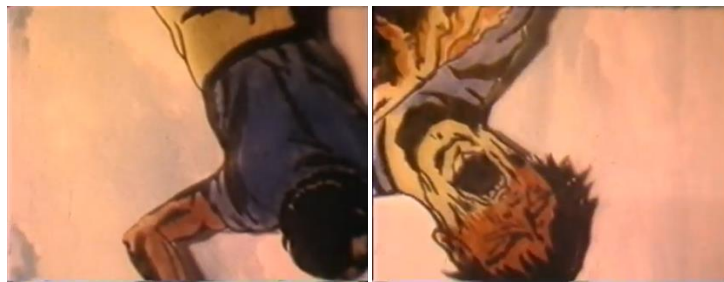
FIG. 10A E 10B – FRAME TRATTI DAL CORTOMETRAGGIO IL GIOCO DELL'OCA