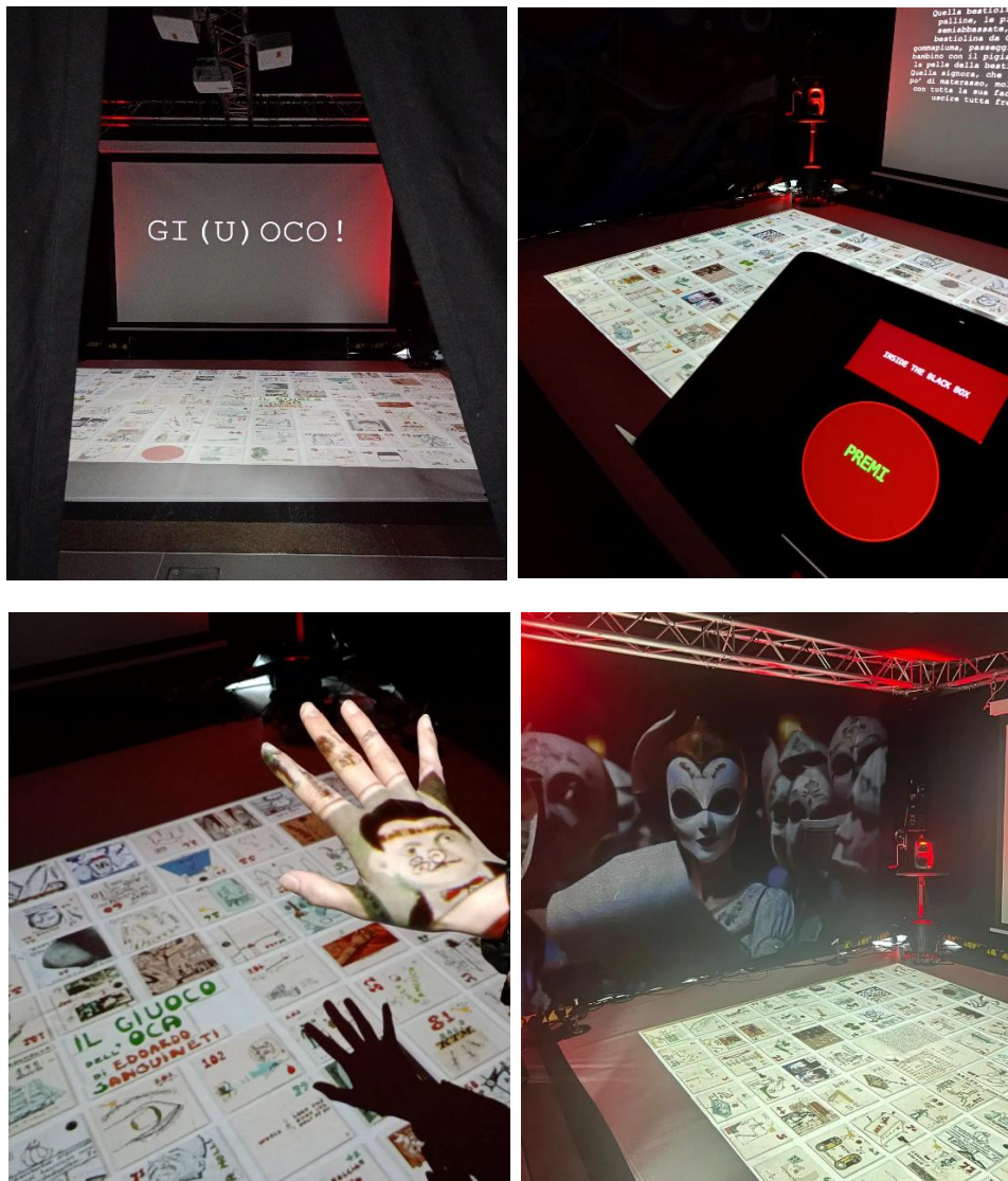
FIG. 2 – BLACK BOX