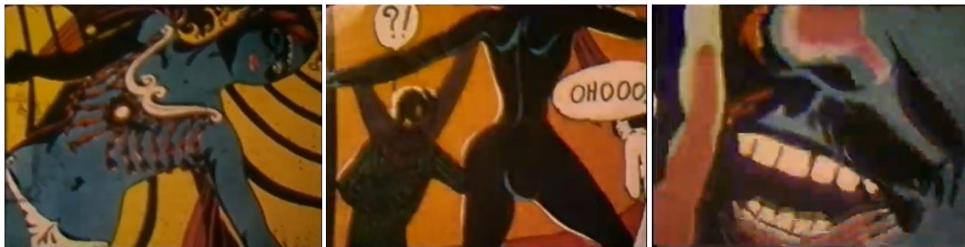
FIG. 11A, 11B E 11C – FRAME TRATTI DAL CORTOMETRAGGIO IL GIOCO DELL'OCA