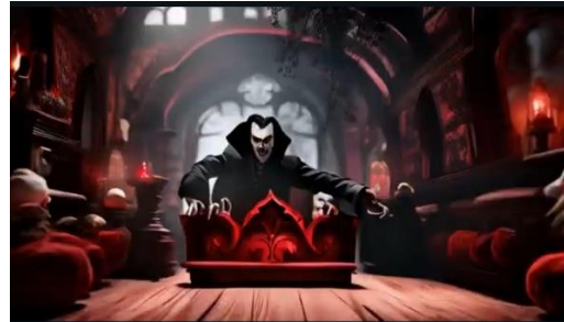
FIG. 4A E 4B – FRAME DELLA CASELLA 1 DE IL GIUOCO DELL'OCA GENERATO DALL'A.I.