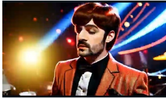
FIG. 6 – FRAME DELLA CASELLA 74 DE IL GIUOCO DELL'OCA GENERATO DALL'A.I.