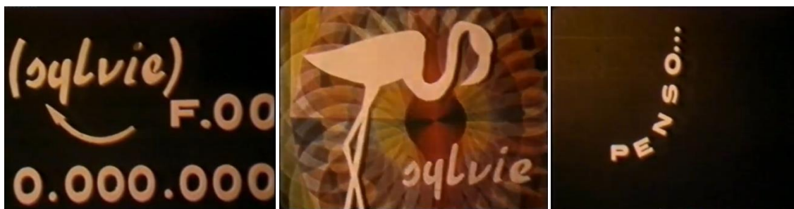
FIG. 12A, 12B E 12C – FRAME TRATTI DAL CORTOMETRAGGIO IL GIOCO DELL'OCA