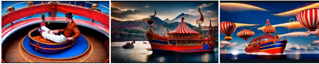
FIG. 7A, 7B E 7C– FRAME DELLA CASELLA 111 DE IL GIUOCO DELL'OCA GENERATO DALL'A.I.