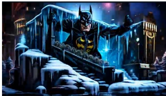
FIG. 5 – FRAME DELLA CASELLA 59 DE IL GIUOCO DELL'OCA GENERATO DALL'A.I.