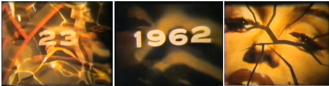
FIG. 13A, 13B E 13C – FRAME TRATTI DAL CORTOMETRAGGIO IL GIOCO DELL'OCA