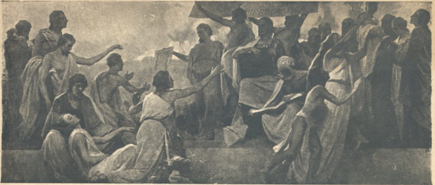
LA SCUOLA MEDICA SALERNITANA (Dal Gruppo decorativo dell'aula della Università di Salerno - Palazzo di Città)