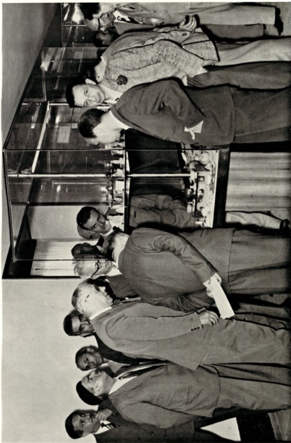
Una parentesi dei lavori: Visita dei Convegnisti al Museo Nazionale di Paestum.