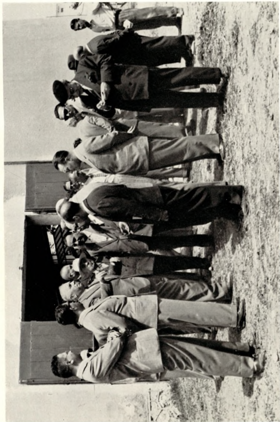
Visita ad un'Azienda Agricola nella Piana di Battipaglia