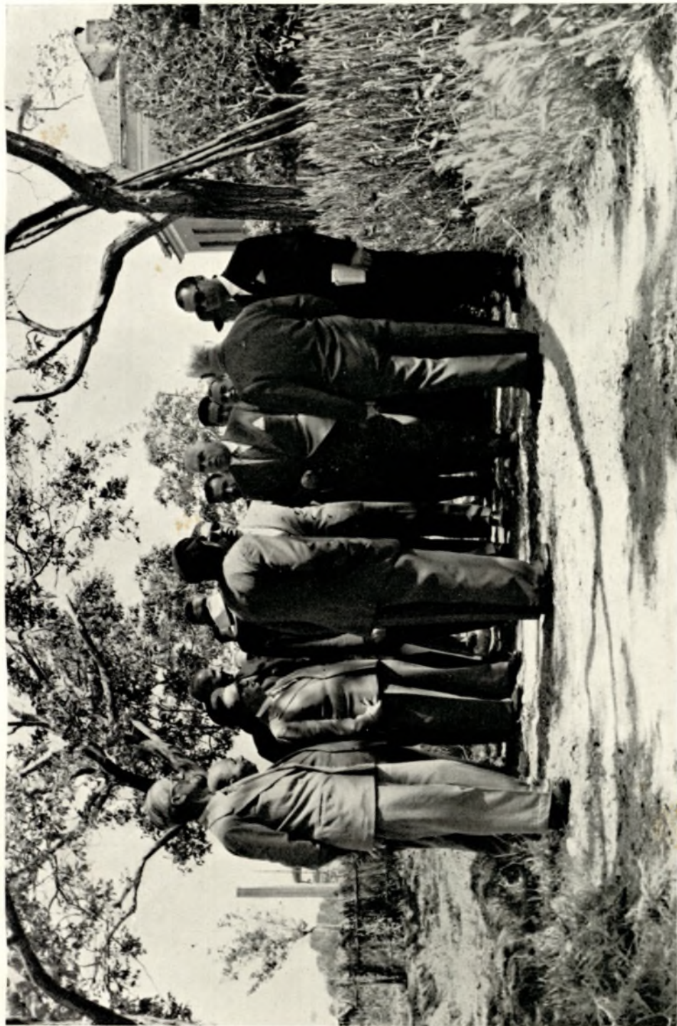
Visita dei Convegnisti ad un'Azienda Agraria nella Piana del Sele