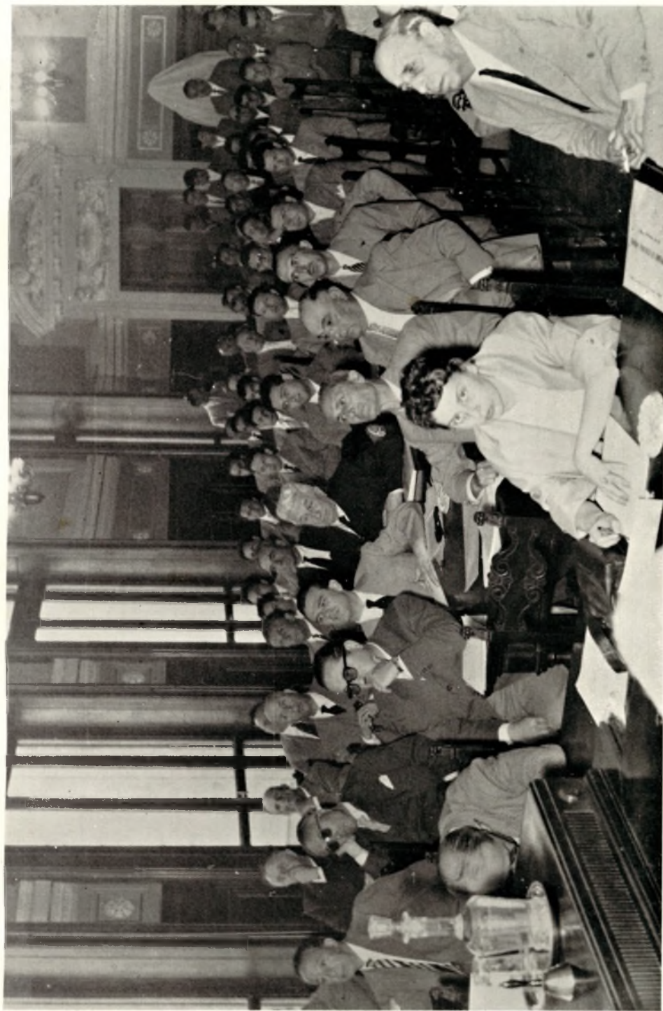
Un aspetto della Sala durante il Convegno.