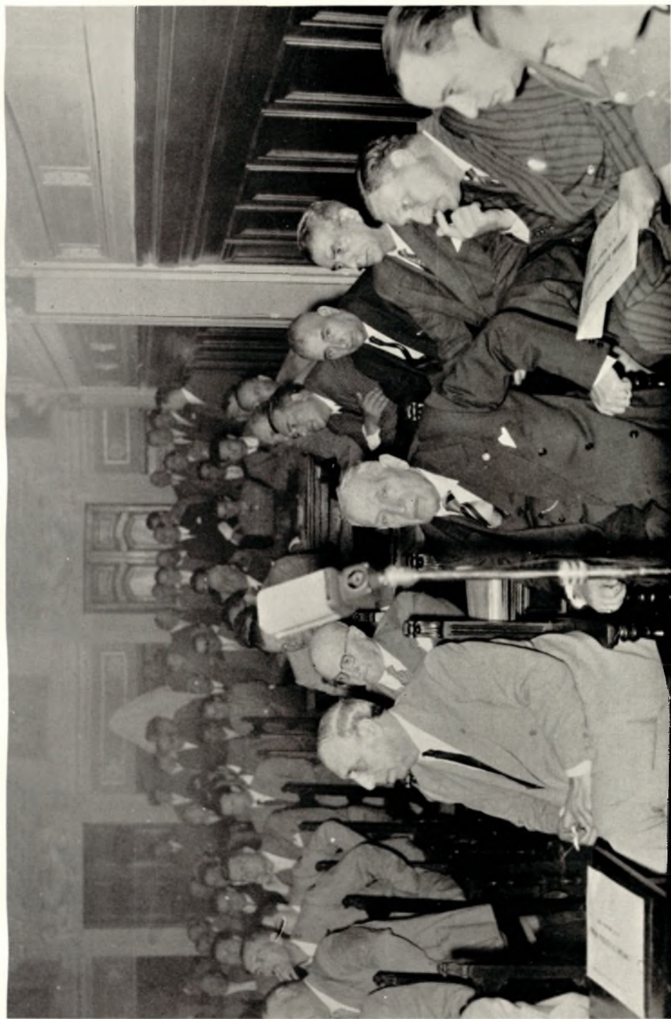
Altro particolare della Sala durante il Convegno.