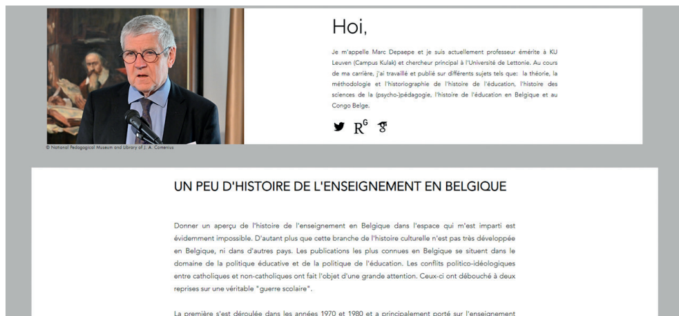
Imagen 3. Apartado de la página web dedicado al contexto histórico-educativo