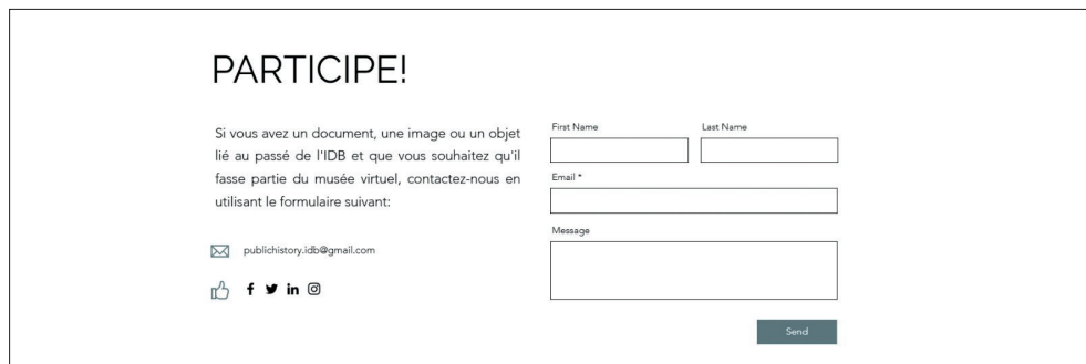
Imagen 2. Sección de crowdsourcing con el formulario que se debe rellenar para participar en el proyecto

proporcionar a los visitantes una comprensión completa y clara del propósito, proceso y relevancia del proyecto en cuestión. Al finalizar esta sección, empieza el apartado dedicado al contexto histórico-educativo que resalta la evolución del sistema educativo en Bélgica, centrándose específicamente en el papel desempeñado por la escuela católica. Este contenido, elaborado de manera clara y accesible por Marc Depaep, brinda una comprensión más profunda del contexto histórico que rodea a la institución, permitiendo al usuario obtener una visión más completa de la vida cotidiana en las escuelas y cómo las decisiones políticas y los conflictos ideológicos han moldeado el panorama educativo belga a lo largo del tiempo.