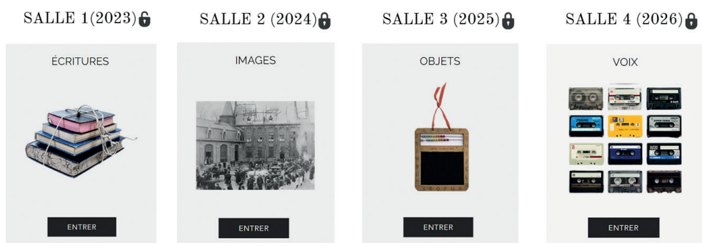
Imagen 4. Museo virtual compuesto por un total de cuatro salas de exposición

de desarrollo de esta publicación, así como la identificación de cambios significativos en su contenido y estilo. Los visitantes de esta sala tendrán la oportunidad de «observar» como era la vida cotidiana del Instituto Don Bosco, explorando de cerca las diversas actividades escolares, culturales, deportivas y socio-religiosas que conformaban el día a día del centro educativo. Por otro lado, la interfaz de usuario evidencia que, por el momento, siguiendo el plan de apertura gradual, las demás salas permanecen cerradas. A finales del año 2024, se llevará a cabo la inauguración de la sala dedicada a las fotografías, con un enfoque centrado en capturar visualmente los momentos más emblemáticos de la historia del instituto. Este cronograma continúa en 2025 con la apertura de la sala de los objetos, destinada a exponer utensilios y artefactos escolares, proporcionando una dimensión tangible y material a la experiencia