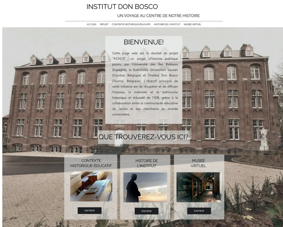
Imagen 1. Interfaz de bienvenida de la página web

con valiosos elementos que han sido parte del pasado del Instituto Don Bosco. Desde fotografías emblemáticas hasta anécdotas entrañables, cada aportación se convierte en un «ladrillo» que consolida el relato histórico que se transmite a través de la página web. Este enfoque participativo permite que cada miembro, ya sea antiguo alumno, profesor o personal administrativo, se convierte en un archivero de la historia compartida. La diversidad de materiales y perspectivas se entrelazan para formar un tapiz dinámico y genuino que da vida a la herencia histórica del instituto.