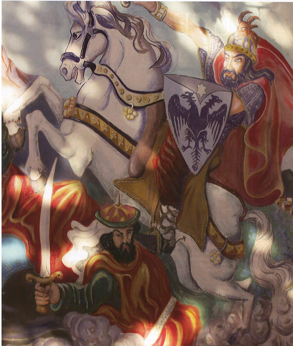
Murale di Giovanni Troiano, raffigurante l'eroe albanese Scanderbeg, Civita (Cs)

Scanderbeg, nel 1462 sconfigge i ribelli a Orsara. Nel 1464, grato dell'aiuto ricevuto da Scanderbeg, gli dona i feudi pugliesi di Monte Sant'Angelo e di San Giovanni Rotondo 20 .