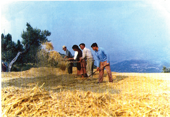
Lavoro nei campi, Mongrassano (Cs)

Appare evidente, quindi, la ricchezza dei motivi, ma anche la forte componente sociale rintracciabile nei canti espressi durante l'attività lavorativa.