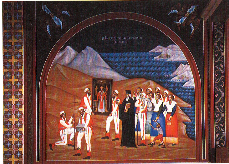
L'arrivo degli albanesi in Italia, Chiesa di S. Attanasio, Santa Sofia d'Epiro (Cs)

ragazzo ritrovò la libertà e con la fanciulla si avviò alla nave, dove altri albanesi li aspettavano per partire verso l'Italia.