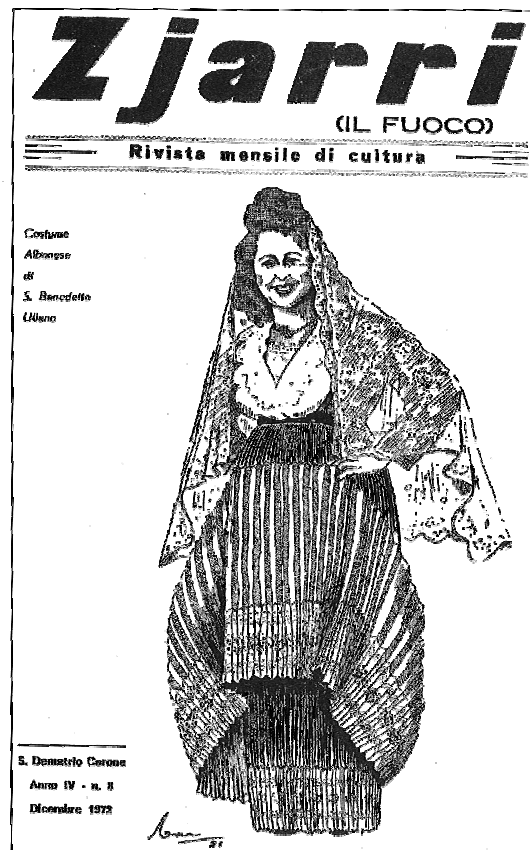
Rivista di cultura italo-albanese, edita a San Demetrio Corone (Cs)

della Grecia, ha alcune affinità con il dialetto toscano (l'albanese è distinto in due dialetti: il ghego al Nord del fiume Shkumbini e il toscano al Sud) 30 . Anche se l'origine è legata all'Albania, si ricorda che le diverse parlate degli arbëreshë «sono rimaste staccate dalla madrepatria e non hanno potuto partecipare alle innovazioni linguistiche colà avvenute» 31 .