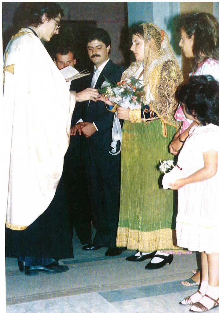
Matrimonio italo-albanese, San Demetrio Corone (Cs)