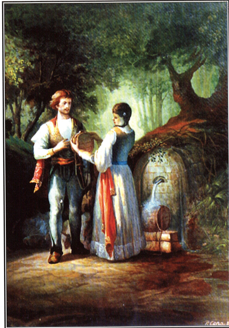
Petrit Ceno, I canti del Milosao (poema di Girolamo De Rada)

I testi d'amore, come tutti i canti popolari, esprimono vari stati d'animo in maniera semplice, servendosi spesso dell'immediatezza delle immagini evocate: