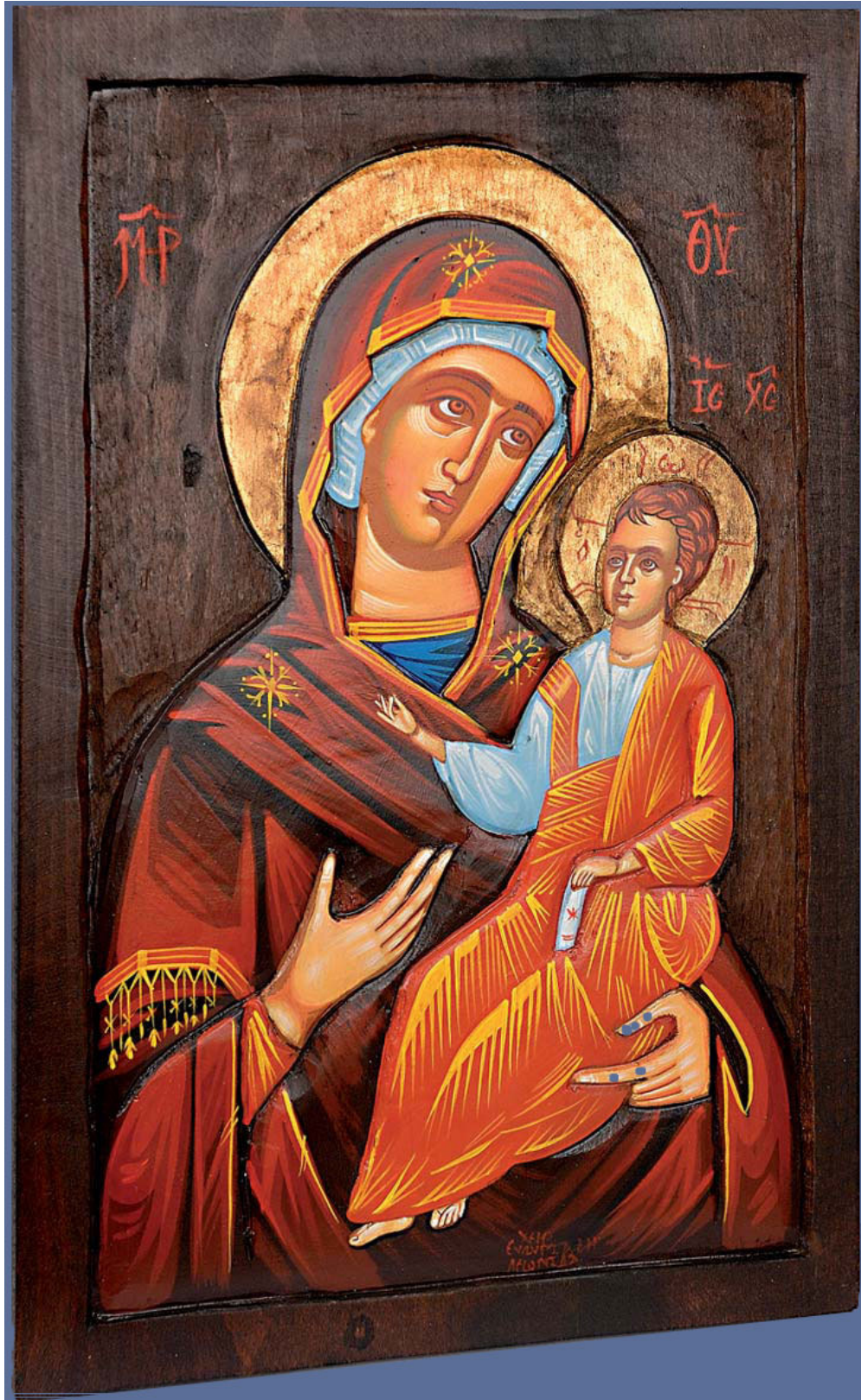
Madonna Odigitria, Icona