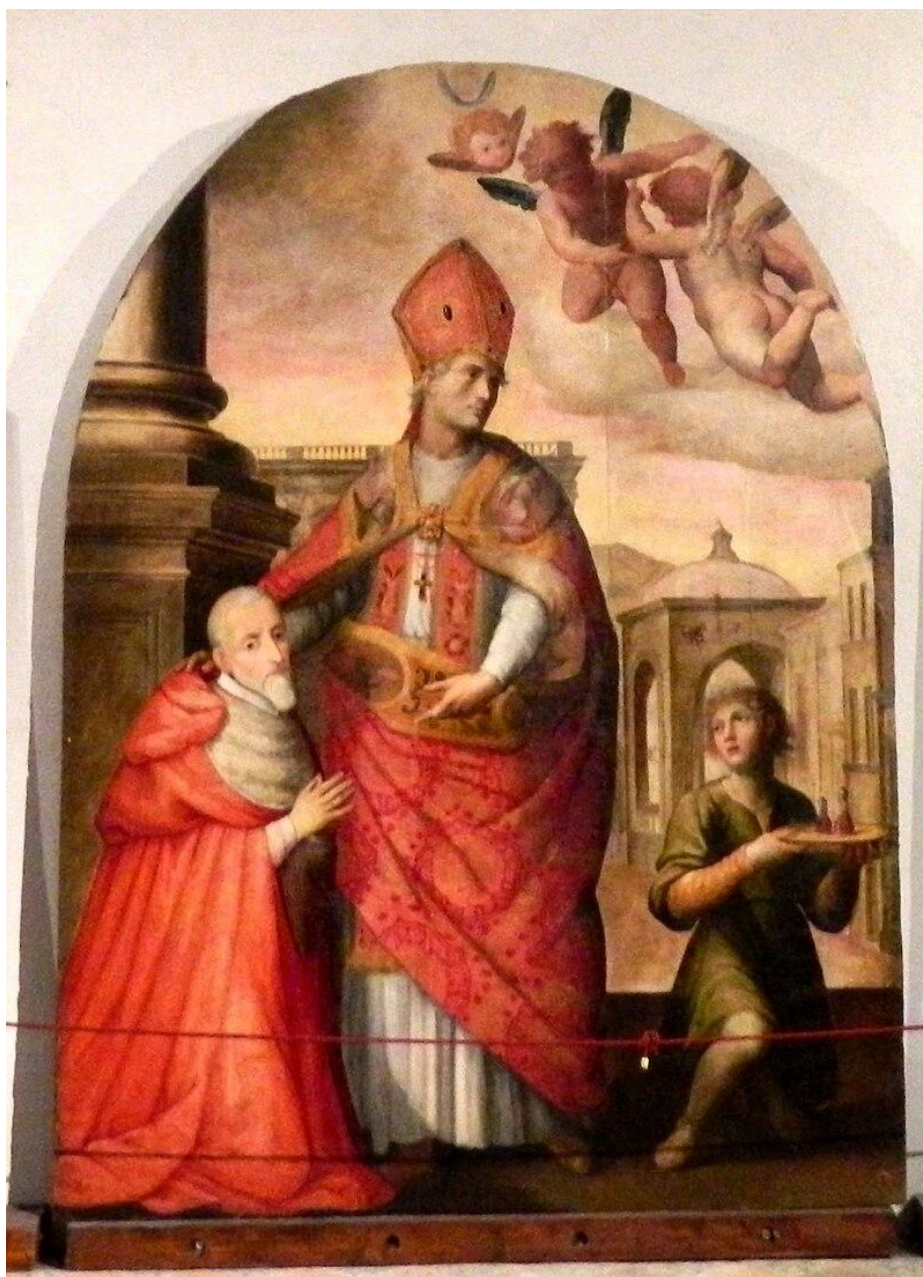
Fig. 4. Giovanni Balducci, San Gennaro presenta Alfonso Gesualdo , Napoli, Museo Arcivescovile.