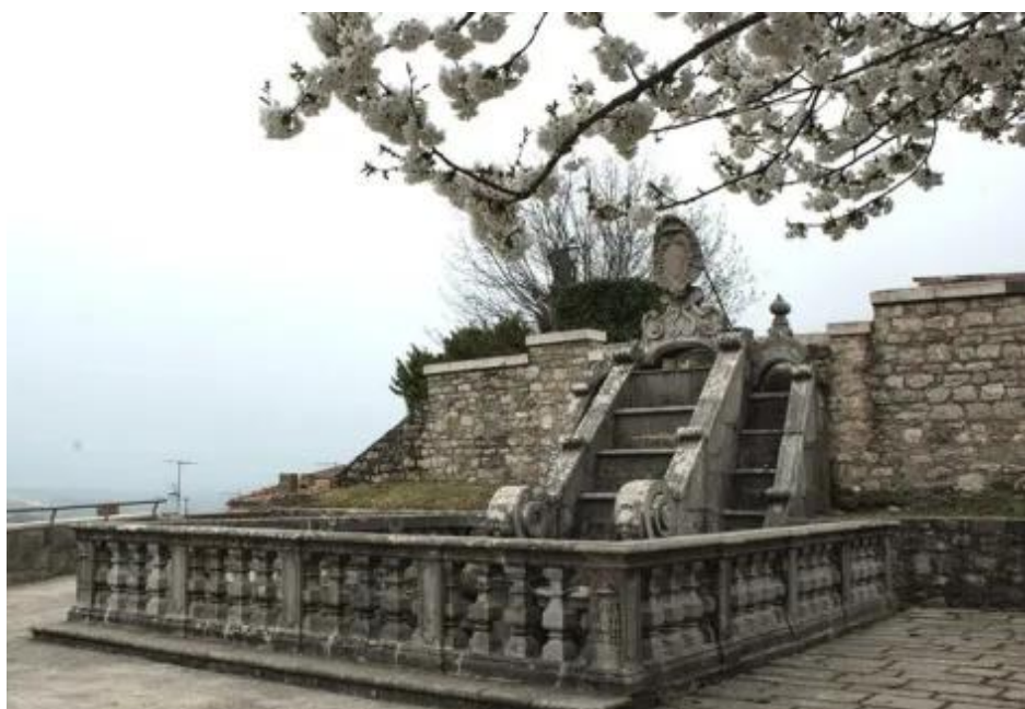
Fig. 1. Giardini del palazzo episcopale e signorile, Sant'Andrea di Conza.

dosso promosso da Clemente VIII e poi da Paolo V, durante il triplice mandato ecumenico di Matteo II (1596, 1598-1602, 1603) 30 che aveva smussato la dimensione anticattolica di Melezio I e gli scandali di Neofito II, con un gesto d'indipendenza verso l'impero osmanle come la canonizzazione di Filotea d'Atene. D'altro lato, il cranio dell'apostolo è fra le reliquie-cardine della tribuna vaticana, e la devozione per il fratello di Pietro significa anche legame forte col papato. Ancora una volta, dunque, la committenza gesualdiana si mostra in grado di evocare ad un tempo le proprie radici consortili (che si declinano nel neomichelangiolo) e le proprie complesse letture del ruolo della Chiesa universale.