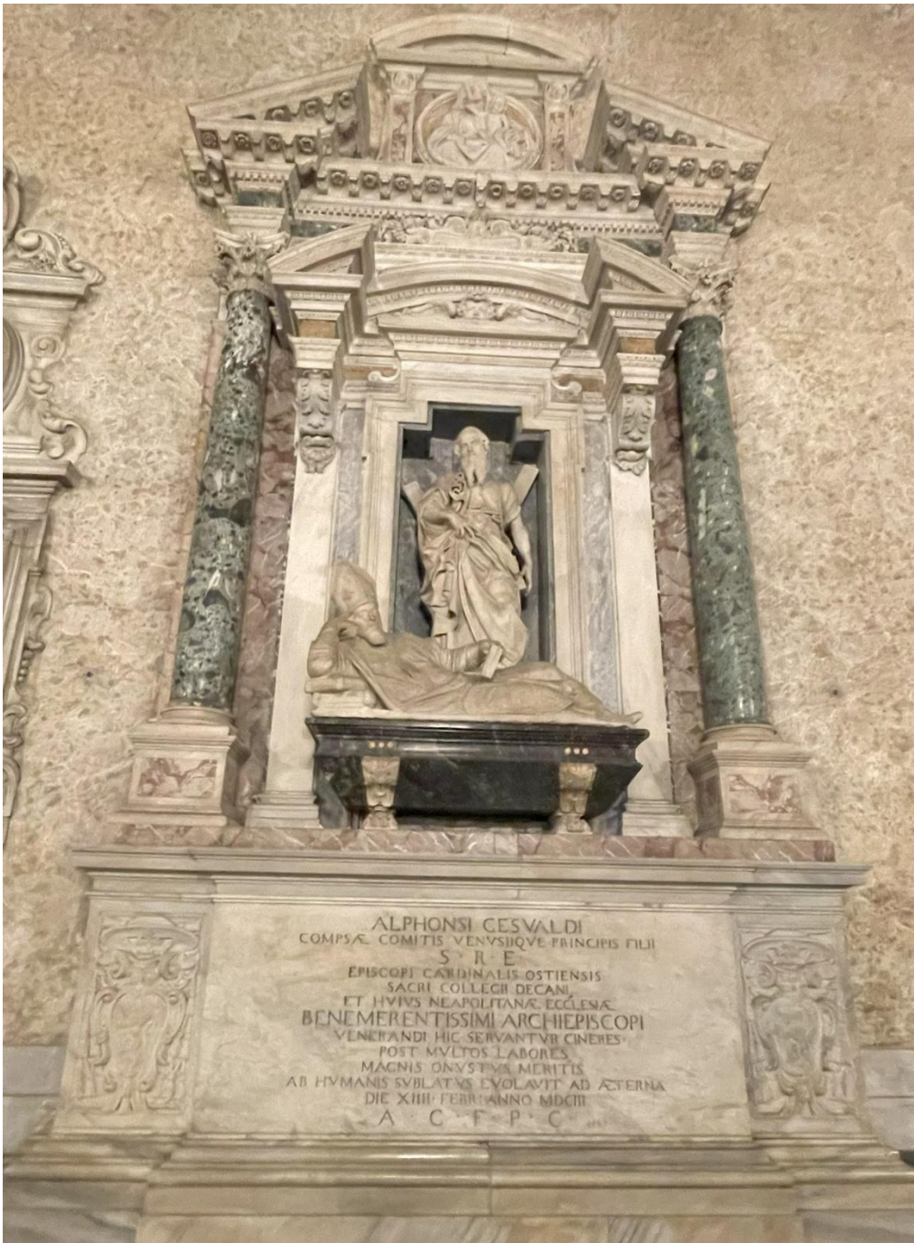
Fig. 6. Michelangelo Naccherino e Tommaso Montani, Tomba di Alfonso Gesualdo , Napoli, Duomo.