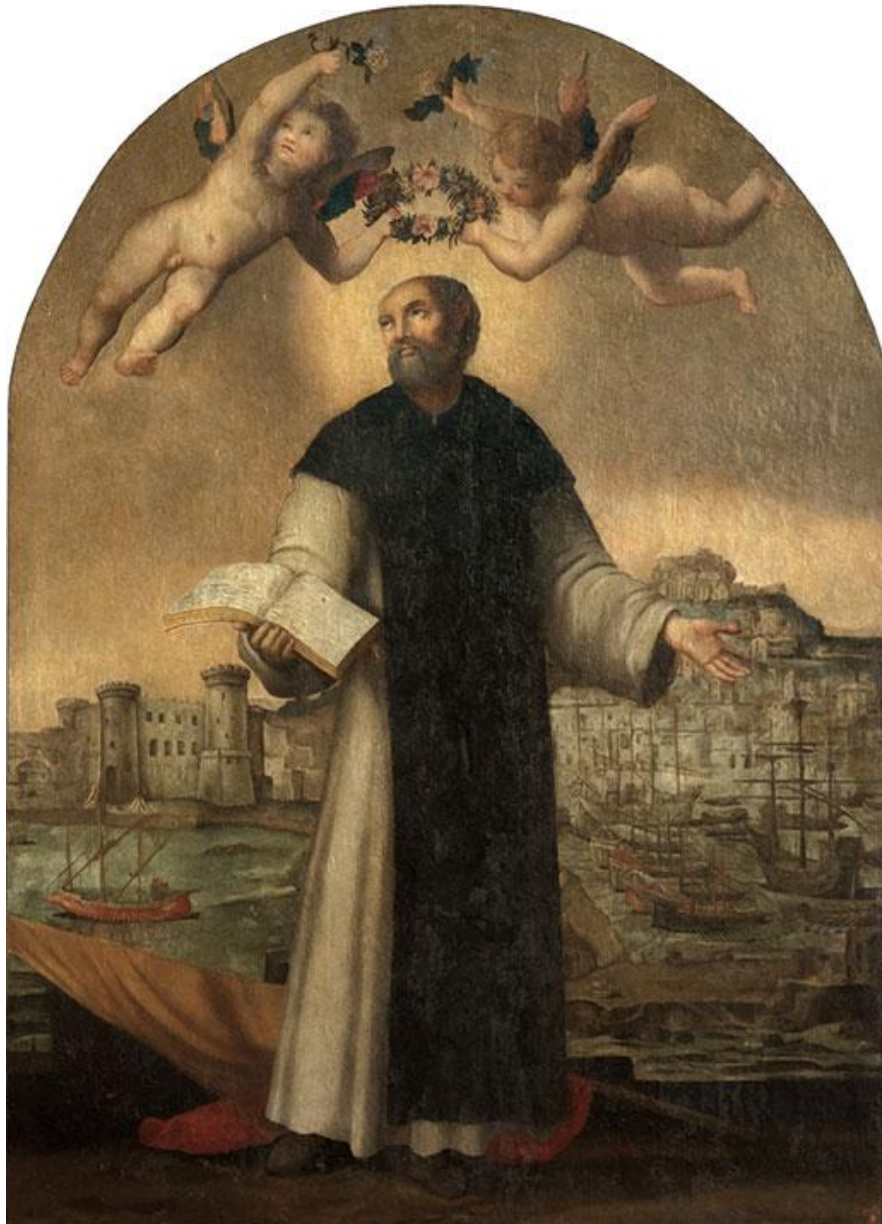
Fig. 5. Giovanni Balducci, Sant'Aniello , Napoli, Museo Arcivescovile.