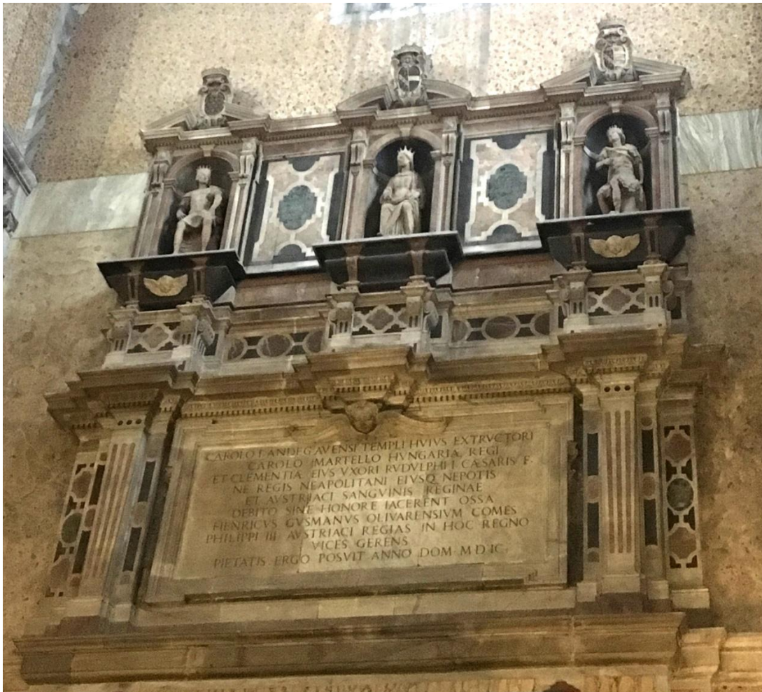
Fig. 2. Domenico Fontana, Pietro Bernini, Giovanni Caccini e Tommaso Montani, Tomba di Carlo I, Clemenza d'Asburgo e Carlo Martello d'Ungheria , Napoli, Duomo.