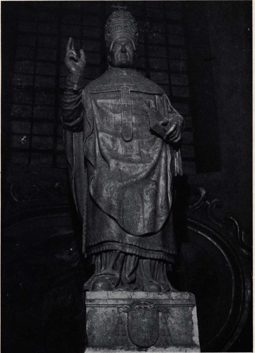
Ilomo di Solenn. F. Cassan: statua di S. Gregorio VII.