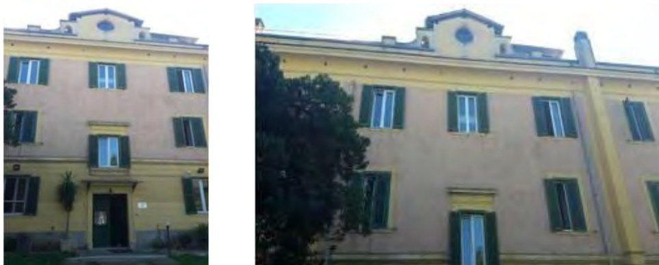
Foto 1-2: Esterno di “Casa Scalabrini” (Foto scattata il 22 settembre 2017”)

Dalla scheda del progetto, emerge come l'intento dell'iniziativa parte dalla necessità di proseguire il percorso di inserimento sociale di coloro che escono dai centri SPRAR e CARA puntando all'acquisizione di una vera e propria autonomia individuale partendo dalla dimensione abitativa che diventa, inevitabilmente, un primo passo verso un processo di integrazione. La “Casa” 15 (Foto 1 e 2), che propone uno stile di vita “misto”, ossia unisce la vita autonoma con quella comunitaria, è collocata tra i quartieri di Tor Pignattara e Centocelle, due vaste aree urbane della città e ha a disposizione trenta posti riservati, ventotto a richiedenti asilo e rifugiati (single, prevalentemente uomini) e due alloggi riservati a piccoli nuclei familiari (aventi non più di due-tre figli)