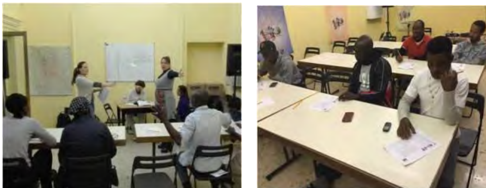
Foto 6 -7 - I corsi di lingua italiana

scopo principale dei corsi di lingua è quello di rafforzare nei partecipanti le proprie competenze linguistiche e comunicative, favorendo l'inserimento scolastico e lavorativo. Da un altro, poi, ci sono i corsi di scuola guida per l'ottenimento della patente di guida (Foto 6 e 7)