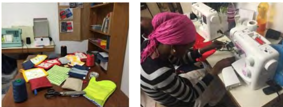
Foto 8-9 - Il Laboratorio "Taglia e Cuci in Tutte le Lingue del Mondo"

Dal punto di vista della crescita professionale sono previsti corsi di formazione con sbocchi lavorativi sostenibili per i richiedenti asilo, rifugiati e residenti, autoctoni e migranti in sinergia con il territorio, gli enti locali e i servizi sociali. Gli ambiti in cui si attuano questi percorsi sono differenti, dall'agricoltura biologica, al settore tessile, ai mestieri "manuali" ( falegnameria, lavorazione artigianale) e infine, al settore multimediale.