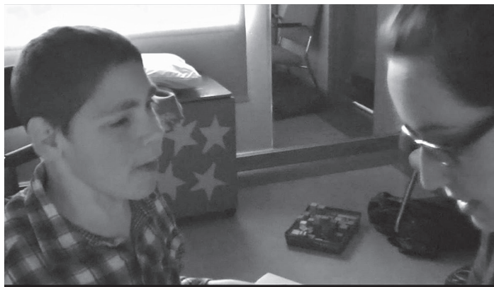
FIGURE 1 Au centre ici