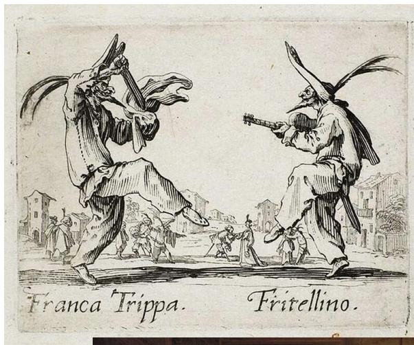
Fig. 18 Jacques Callot, Franca Trippa, Fritellino , incisione su rame, 1622, Napoli, Museo Nazionale di Capodimonte.