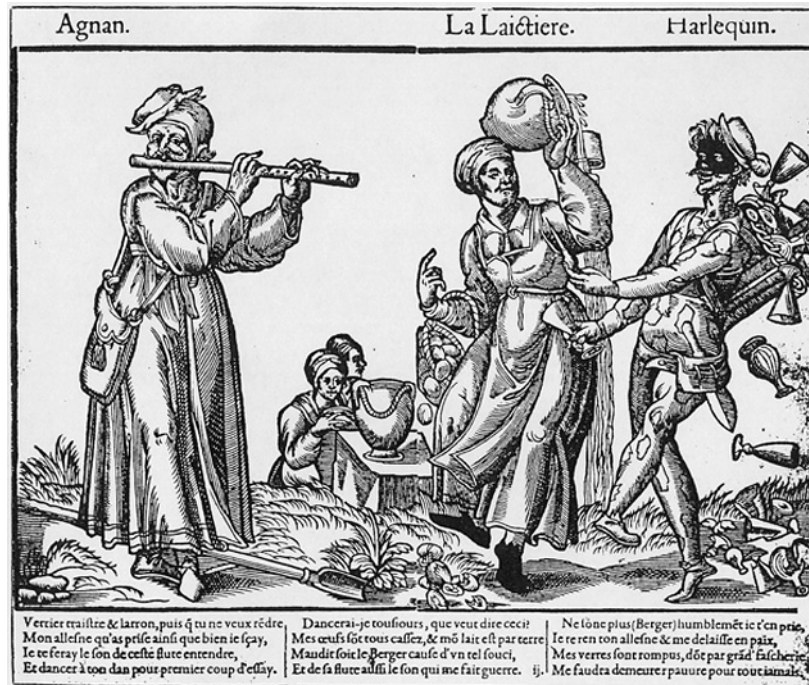
Fig. 2 Agnan, la Laitière, Harlequin , xilografia, 1578 c., Stoccolma, Nationalmuseum.