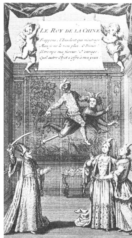
Fig. 8 Arlequin invisible (Le Roi de la Chine) , incisione su rame, 1721, in ALAIN-RENE LESAGE, JACQUES-PHILIPPE D'ORNEVAL, Le Théâtre de la Foire ou l'Opéra Comique , Paris, Ganeau-Gandouin, 1721-1734, vol. I, Parigi, Bibliothèque Nationale de France.