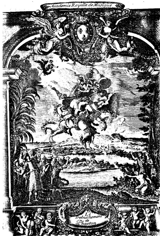
Fig. 4 Jean Bérain dis., Jean Le Pautre inc., Phaéton , incisione su rame, 1683, Parigi, Bibliothèque Nationale de France.