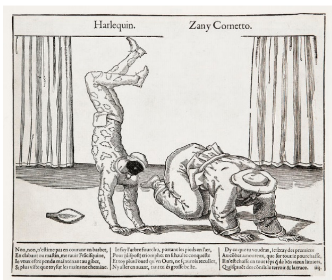
Fig. 15 Harlequin, Zany Cornetto , xilografia, fine sec. XVI, Stoccolma, Nationalmuseum.