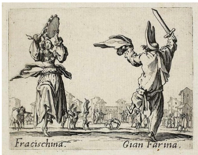
Fig. 14 Jacques Callot, Fracischina, Gian Farina , incisione su rame, 1622, Napoli, Museo Nazionale di Capodimonte.