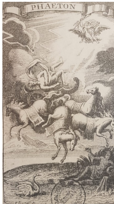
Fig. 6 Franz Ertinger, Phaéton , incisione su rame, 1703, in Recueil général des opéras représentés par l'Académie Royale de Musique depuis son établissement , Christophe Ballard, Paris 1703, vol.III, Parigi, Bibliothèque Nationale de France.