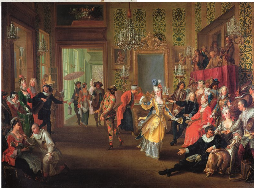
Fig. 19 Ballo di maschere , olio su tela, 1710 c., Collezione privata.