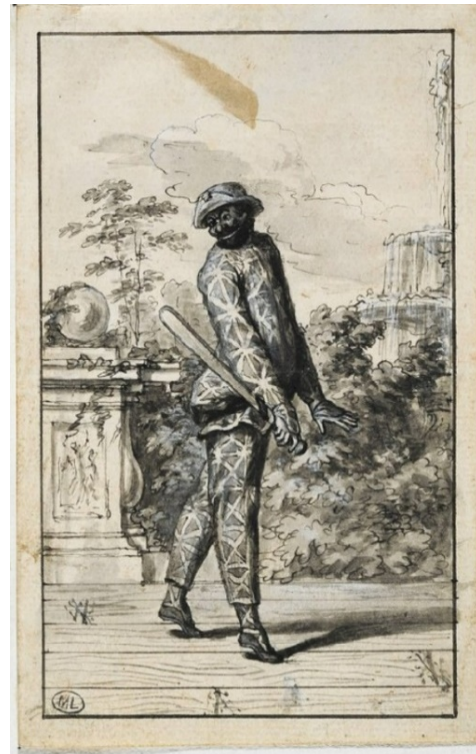
Fig. 20 Bernard Picard, Scaramouche (Giuseppe Tortoriti), disegno, 1695 c., Parigi, Musée du Louvre, Département des Arts Graphiques.