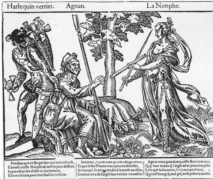
Fig. 1 Harlequin verrier, Agnan, La Nymphe , xilografia, 1578 c., Stoccolma, Nationalmuseum.