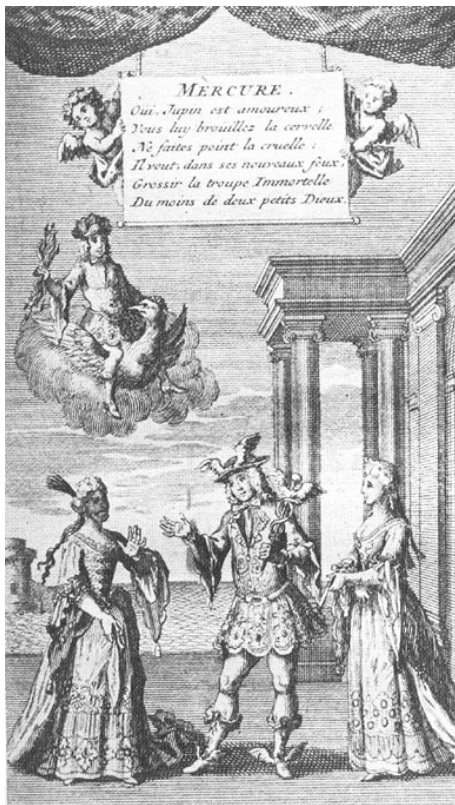
Fig. 7 Arlequin Thétis , incisione su rame, 1721, in A.-R. LESAGE, J.-P. D'ORNEVAL, Le Théâtre de la Foire ou l'Opéra Comique , Paris, Ganeau-Gandouin, 1721-1734, vol. I, Parigi, Bibliothèque Nationale de France.