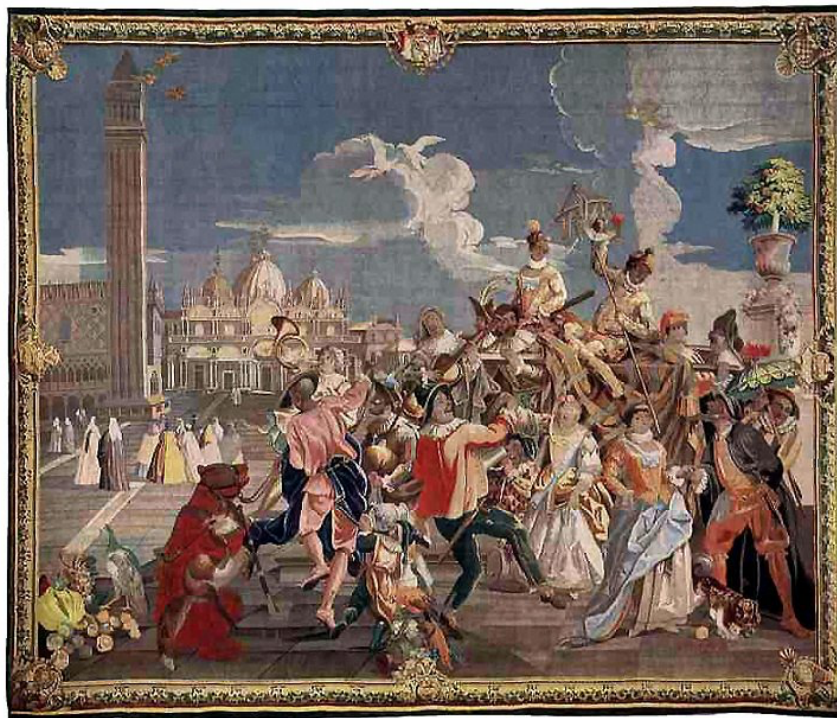
Fig. 12 Andreas Pirot, Festa di carnevale , arazzo, 1745 c., Würzburg, Schloss Veitshoechheim.