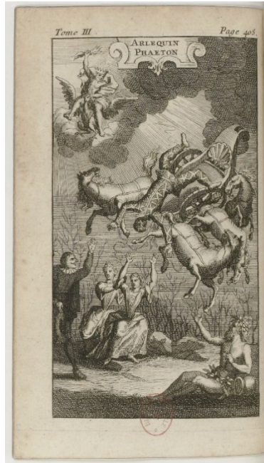
Fig. 5 Arlequin Phaéton , incisione su rame, 1692, in Le Théâtre Italien de Gherardi, Cusson et Witte , Paris 1700, vol. III, Parigi, Bibliothèque de l'Arsenal.