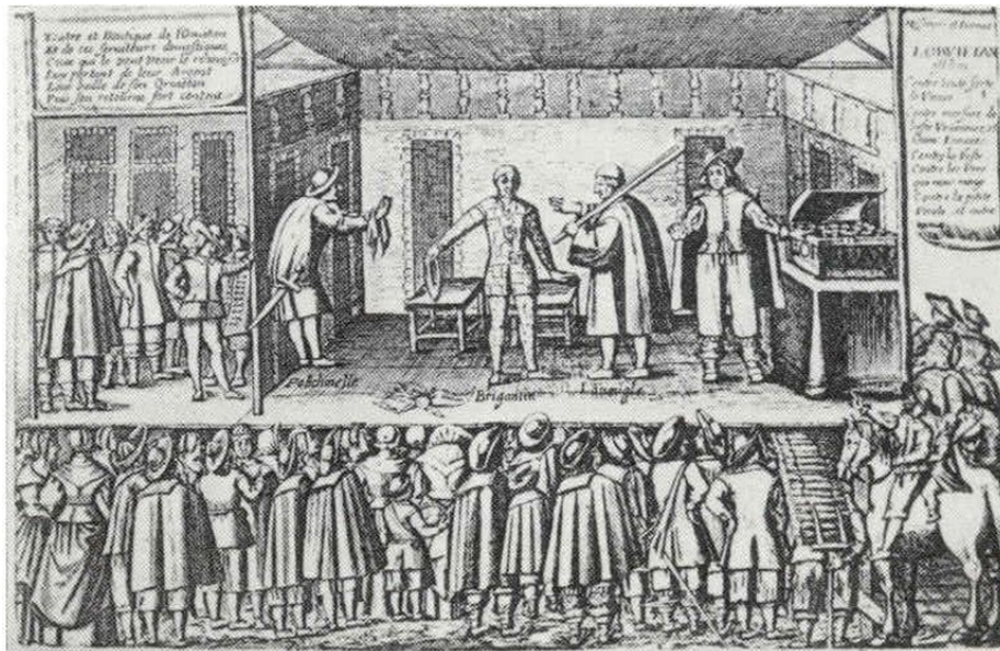
Fig. 3 Théâtre et Boutique de l'Orvietan , incisione su rame, sec. XVII, Parigi, Bibliothèque Nationale de France, Département des Estampes.