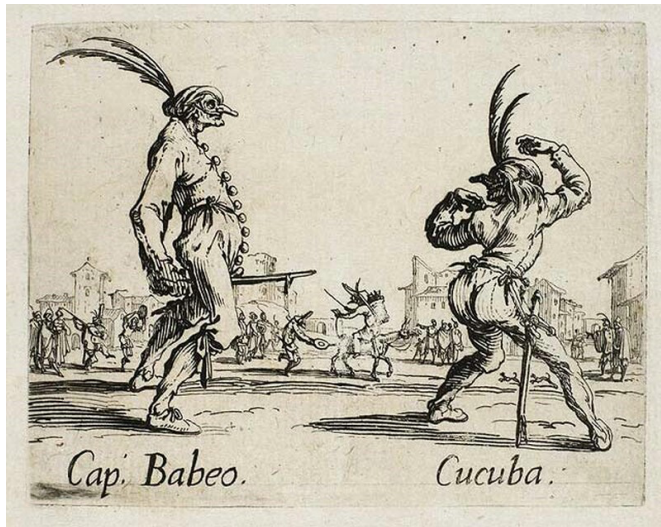
Fig. 13 Jacques Callot, Cap. Babeo, Cucuba , incisione su rame, 1622, Napoli, Museo Nazionale di Capodimonte.