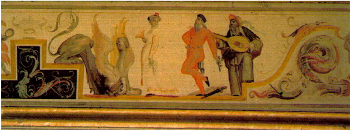
Fig. 9 Antonio Ponzano o da Christoph Schwarz, Cortigiana, Pantalone danzante, Zanni , affresco, 1576?, Landshut, Castello di Trausnitz.