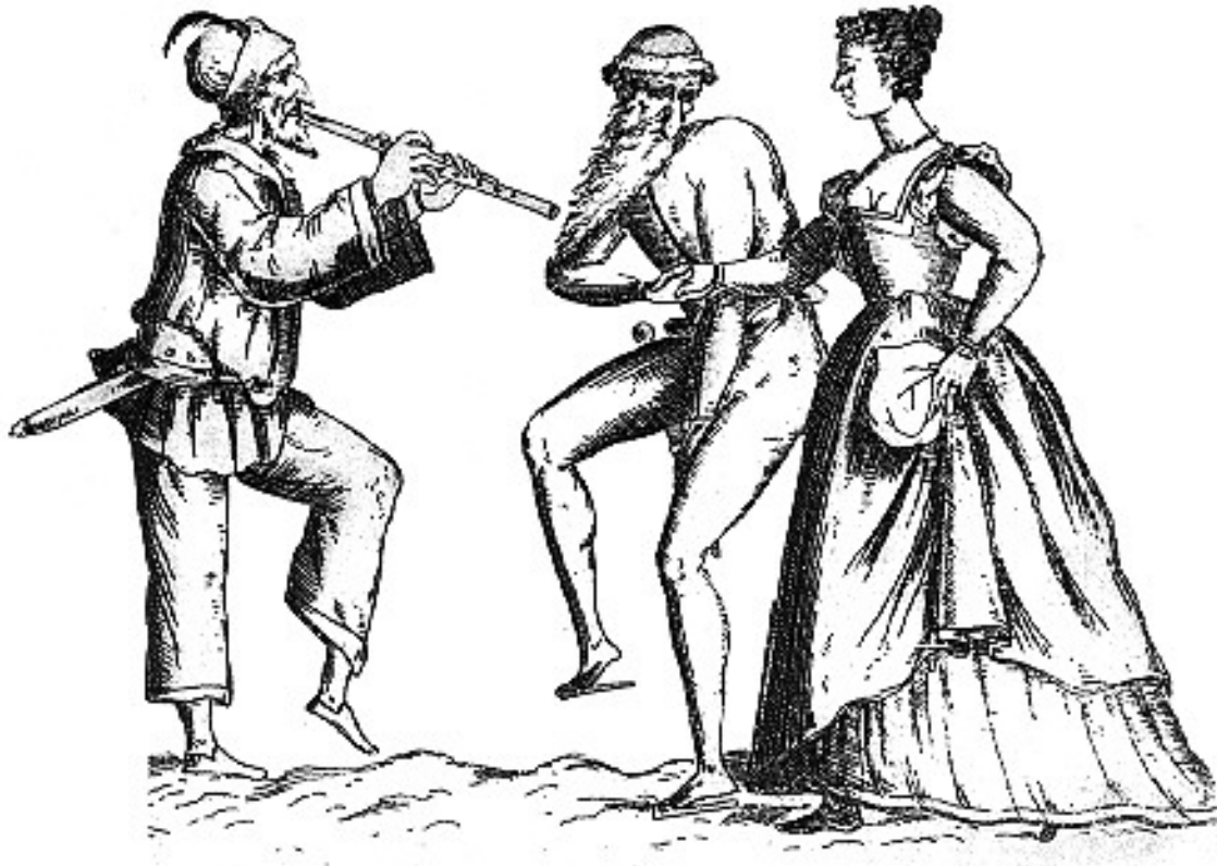
Fig. 10 Ambrogio Brambilla, Il magnifico al ballo , xilografia, fine secolo XVI, Stoccolma, Nationalmuseum.