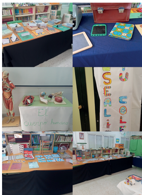
Imagen 11. Diversas vistas del Museo Temporal del CEIP Joaquín Peinado

montaje, decoración y organización del museo temporal.