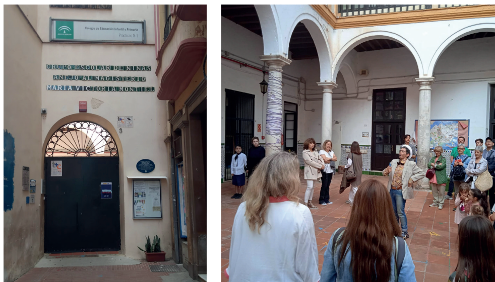
Imagen 1. Entrada al CEIP Prácticas nº 1 en la Plaza de la Constitución y Free tour desarrollado en el patio

Desde hace varios años, cada curso realiza actividades relacionadas con las diferentes épocas históricas del centro. Cada una de esas etapas es investigada y trabajada en las distintas áreas por los alumnos/as y las docentes de cada uno de los ciclos educativos del centro. Este colegio está reconocido como Comunidad de Aprendizaje de forma que la participación de las familias y del voluntariado es intensa. Las actividades están relacionadas con todas las áreas y enfocadas a desarrollar diferentes aspectos del currículo de la actual normativa educativa de educación infantil y primaria. El proyecto de patrimonio, a su vez, está relacionado con otros planes y programas educativos que se llevan a cabo en el centro como el de Aldea, Aula de Cine, biblioteca o el proyecto de mejora del centro.