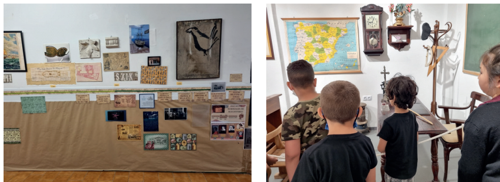
Imagen 3. Línea del tiempo y alumnos conociendo el patrimonio

directa con la asignatura de lengua, la disciplina, el esfuerzo y el uso constructivo del tiempo de ocio.