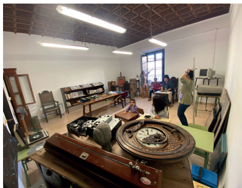
Imagen 5. Vista del Aula-Museo

En síntesis, el CEIP Prácticas nº 1 está comprometido con el patrimonio histórico de las instituciones docentes que han ido ocupando este edificio; es consciente del trabajo realizado, pero también del potencial con que cuenta y que espera ir dando a conocer a la sociedad malagueña.