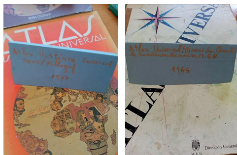
Imagen 10. Cartelería del Museo Temporal