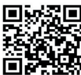
Imagen 2. Código QR de acceso a la Padlet de Patrimonio

En concreto, el alumnado de educación infantil trabaja la etapa en que el centro fue Escuela de Bellas Artes en el año 1851 donde era profesor el padre de Picasso. El espacio donde daba clase, el palomar, ubicado en la parte superior de nuestro colegio, ha sido limpiado y despejado, allí se ha encontrado mobiliario, documentos, dibujos... El actual palomar venía de ser un lugar inhabilitado por el abandono y el paso del tiempo. En un primer momento se realizó una visita por parte del profesorado, hasta donde las circunstancias lo permitían, para tomar conciencia acerca de la importancia del lugar, así como para poder observar su singular arquitectura que se puede ver desde el patio central del colegio.