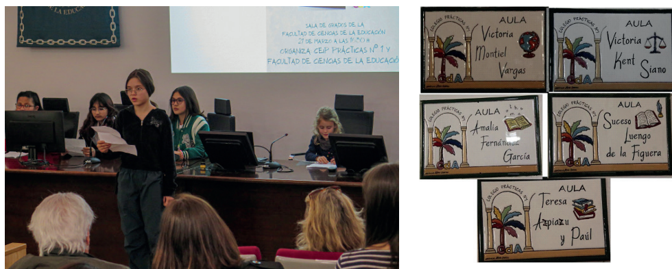
Imagen 4. Mujeres ilustres: Acto en la Facultad de Ciencias de la Educación y placas descubiertas en el colegio

Dentro de la historia del edificio del colegio, las actividades relacionadas con la época en que fue Escuela Normal fueron el núcleo del proyecto llamado “Musealiza tu cole” dado que en el colegio se conservan materiales de esta etapa como cuadernillos y fotografías. La relación entre el colegio y la Universidad permitió dar a conocer la historia de cinco de estas mujeres en un acto en la Facultad de Ciencias de la Educación, en el que participó alumnado y profesorado del colegio, dentro de los actos académicos organizados en torno al 8 de marzo. Cada mujer ilustre estaba representada por una niña que, convenientemente disfrazada, aparentaba estar dormida. Otro alumno o alumna contaba brevemente algo de su biografía y preguntaba al público si quería saber más. Al responder todos que sí, se acercaba al personaje, le despertaba y éste nos contaba su propia historia.