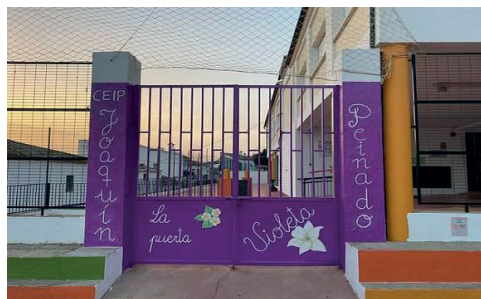
Imagen 6. C.E.I.P. Joaquín Peinado (Montecorto, Málaga) (URL: < https://www.ceip-joaquinpeinado.com/ > [último acceso: 27/09/2024])

ello, es lógico que uno de los primeros pasos haya sido implicar a los docentes de las escuelas a través de este tipo de proyectos, teniendo así la oportunidad de dar a conocer lo que las paredes de sus centros educativos escondían. Quizás para muchos, un libro, un cassette o una diapositiva de los años setenta no tenga valor alguno, o consideren que hay que no tienen ninguna utilidad, pero lo que se está consiguiendo a través de maestros y maestras enamorados del pasado de las escuelas, es que todos estos objetos,