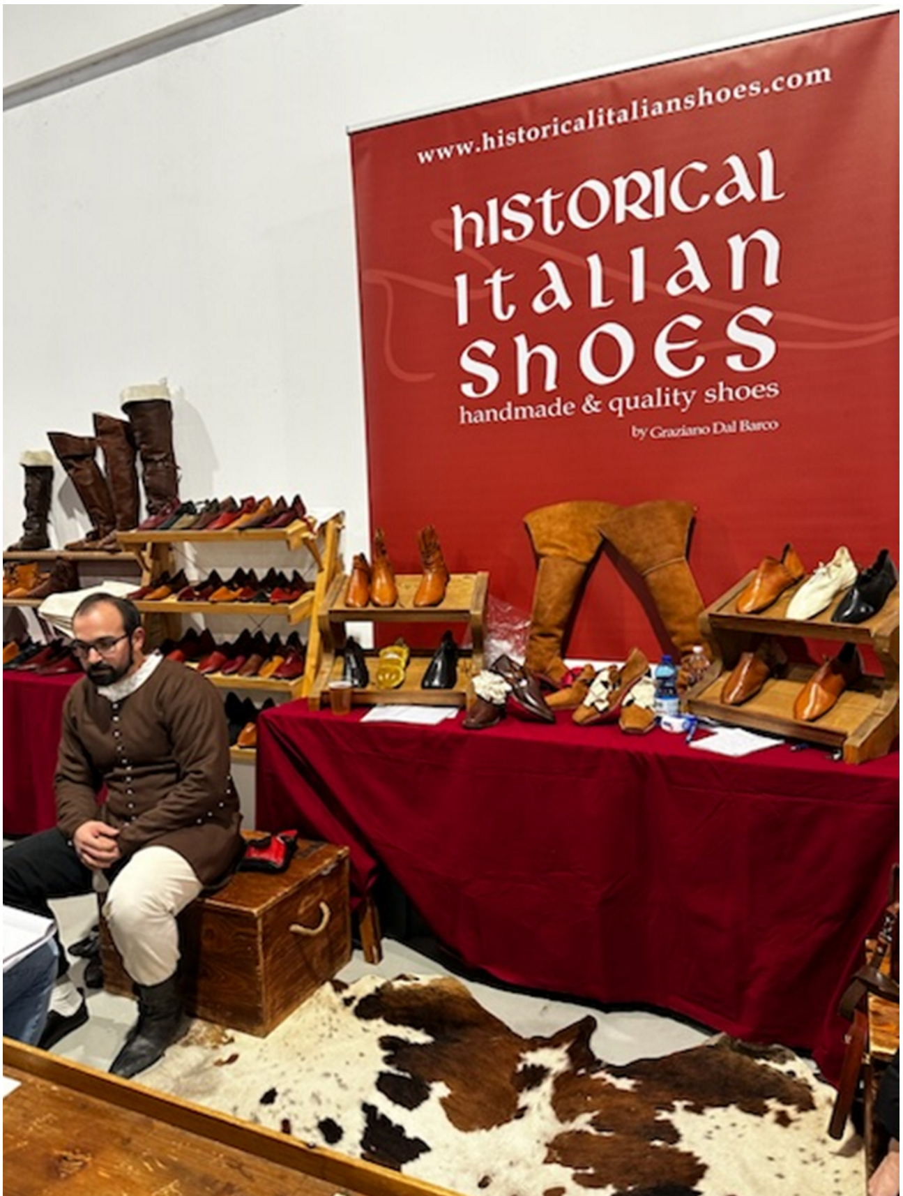
Fig. 2 Banchi di artigiani alla fiera Usi&Costumi (Ferrara 2024) © Enrica Salvatori.

Si tratta di attività e prodotti indubbiamente specialistici e di nicchia, formalmente portati avanti da associazioni o piccole imprese, oggi rappresentate in almeno due fiere